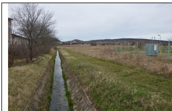
Az alattuk folyó Séd patak