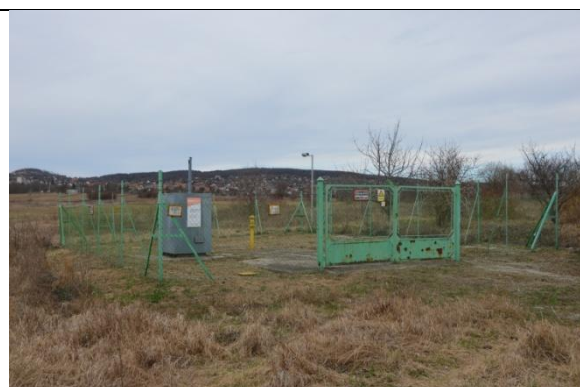
A 0100/23. területen lévő gázf. áll.